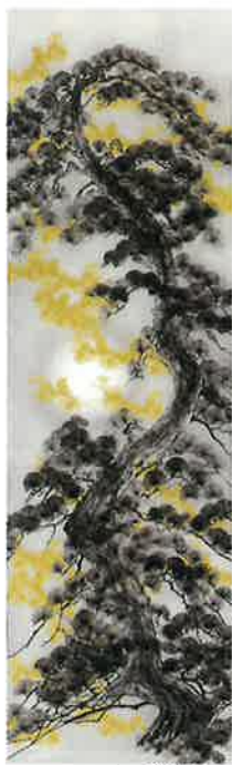
墨絵「吉祥の瑞龍松」

阿部朱華羅 SCARA 美術家・墨絵師。森羅万象のを感じ地平天成を祈り日本古来の美と魂×宇宙を表現し未来へ繋ぐ。国際コンペにて日本代表作品に選出パリルーブル美術館内の世界大会に参加などヨーロッパ各地・ニューヨーク等、国内外で受賞・招待展示多数。森と文化を楽しむツナグの森企画主宰。