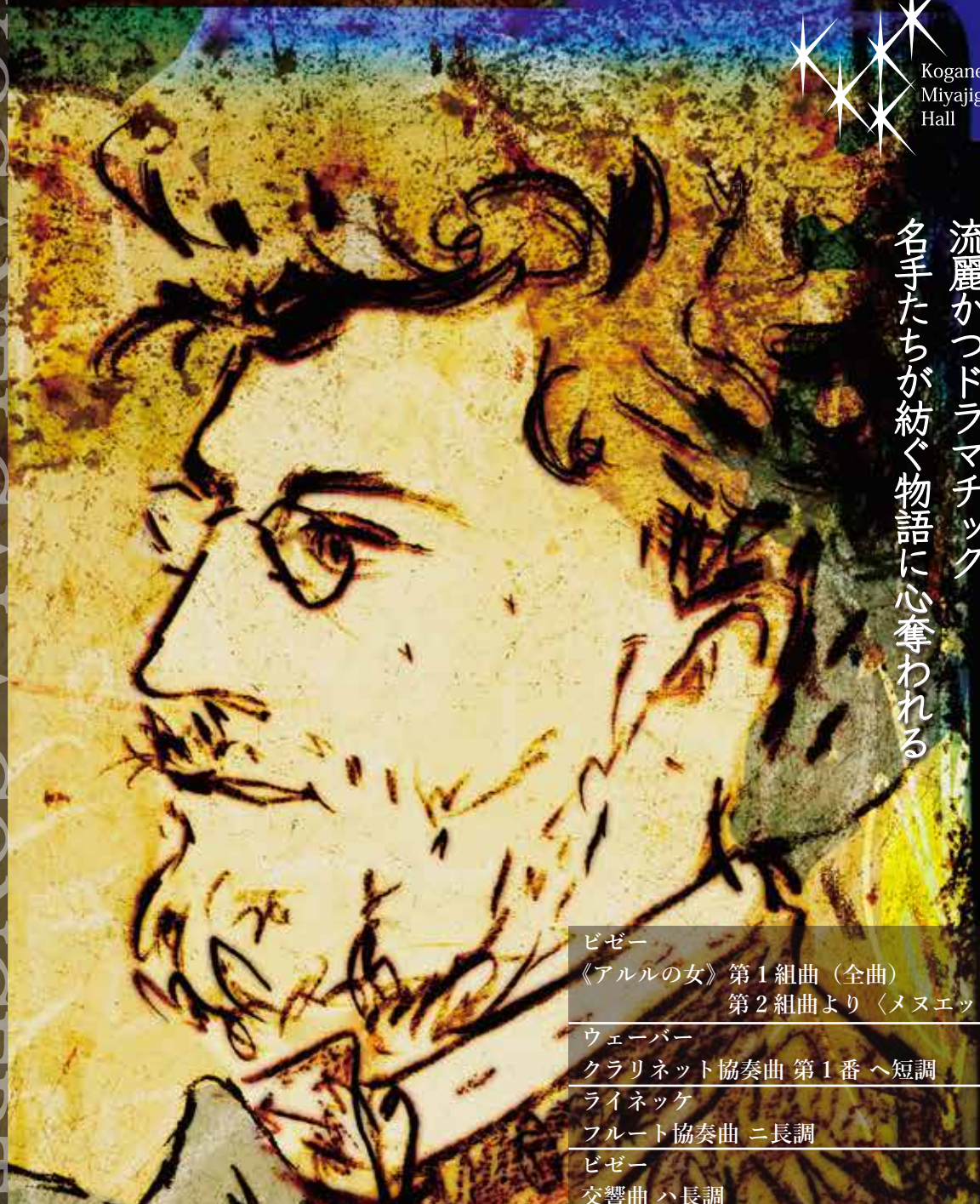
Illustration: Kazeki Takazawa

ビゼー 《アルルの女》第1組曲（全曲） 第2組曲より〈メヌエット〉 ウェーバー クラリネット協奏曲 第1番 へ短調 ライネッケ フルート協奏曲 ニ長調 ビゼー 交響曲 ハ長調