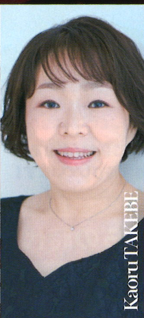
武部薫 (メゾソプラノ)