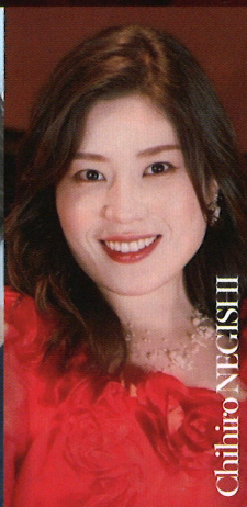
根岸千尋 (メゾソプラノ)