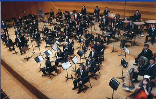
演奏 ハーツウインズ