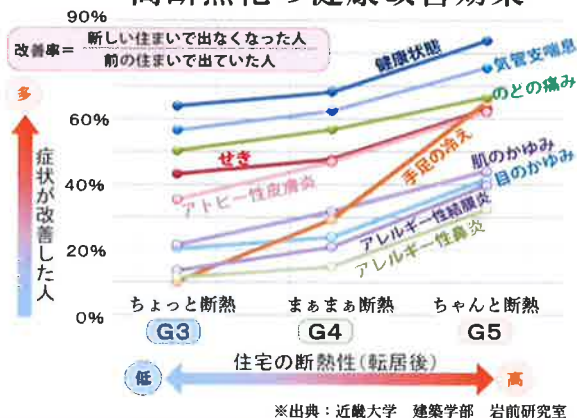
※出典：近畿大学 建築学部 岩前研究室