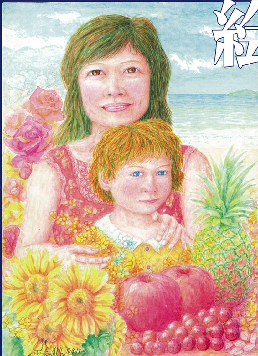
沖縄がはぐくむチェルノブイリ、フクシマの生命