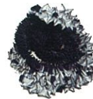
手蜘蛛絞り / 村井泰子