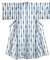
浴衣 / 赤石和子