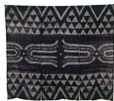
暖簾 「いいときも、わるいときも」 / 青柳恵