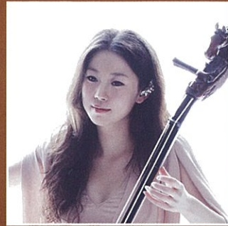
Yilana イラナ オルティンドー・馬頭琴

2008年モンゴル国文化前衛活動家章受賞。2013年エルベグルジモンゴル国大統領杯第1回国際モンゴルホーミーコンクール金メダル。2015年モンゴル国北極星勲章受賞。